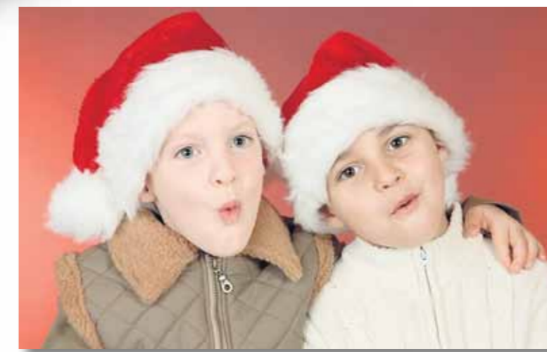
○ Forbrugermagasinet Tænk slog for nylig fast, at det ikke kan betale sig at printe billeder selv. Mens det koster mellem 2,80 og 3,50 kr. at printe julebilledet af ungerne derhjemme, så skal man maksimalt slippe 1,50 kroner per foto - inklusive forsendelse - hvis man bruger en af de mange fototjenester på nettet.